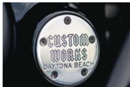
Inte riktigt allt är svart.

A tt hitta hojar att göra reportage om till IronWorks är lite besläktat med att jaga tryffel... Jag vet aldrig riktigt hur det ska gå till, men jag tror att sticker jag bara in näsan på tillräckligt många ställen, så hittar jag dem. Jag stressar inte.