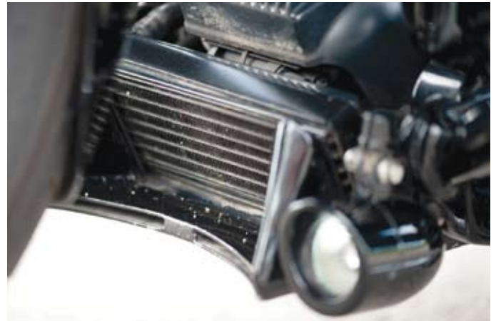
Ett handgjort scoop döljer en oljekylare.

alla de pulverlackerade delarna skulle matcha varandra. Det här, gott folk, är att vara noga med detaljerna.