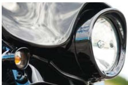
Blänkande svarta detaljer.