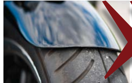
Dave vill ha skärmen tigt mot däck.