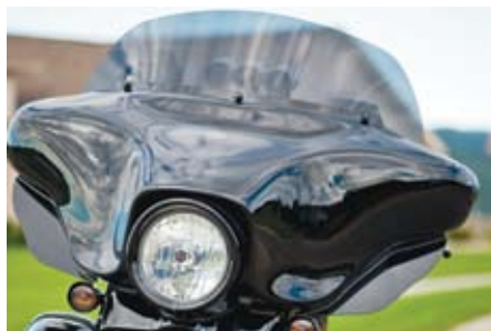
Vindavvisare gör hojen mer dragfri.