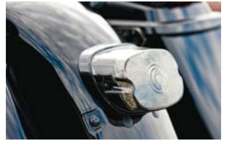
En svart lykta funkare inte men väl en rökfärgad.