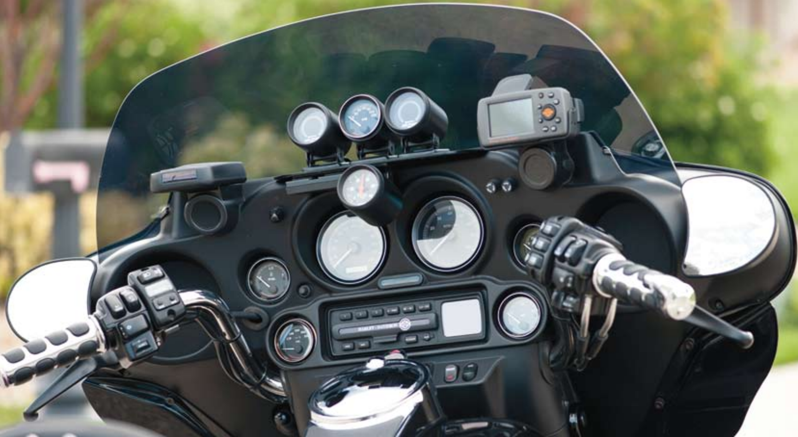
Smågodis för långturen.